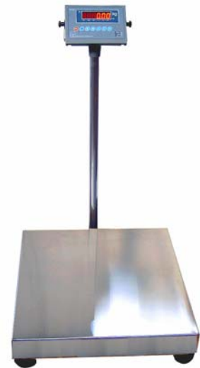
Bilico elettronico B314